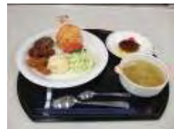
↑ お子さまランチプレート