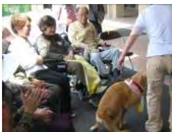
←人気のドッグセラピーの様子

定例の書道教室・ちぎり絵教室・癒し絵教室・大正琴教室等に加え、7月4日には『手芸教室』が初開催されました。また、穏やかな季節限定開催のドッグセラピーも大人気でした。開催日が日曜日ということもあり、面会にいらっしゃった大勢のご家族の皆様も参加されました。特に小さなお子様にとっても、賢いワンちゃんたちとのふれあいは楽しいイベントであったようです。